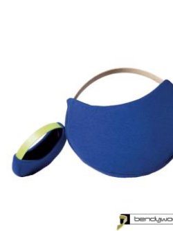
Borsa a mano "Bendy Bag" in Bendywood®