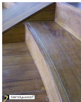
Bordi scalini in Bendywood®