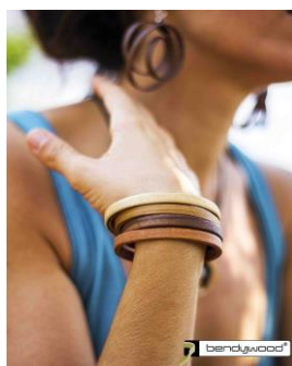
S'Ona, Palma de Mallorca, Spagna