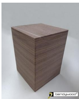
Candidus Prugger, Italia