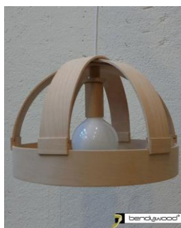
Candidus Prugger, Italia