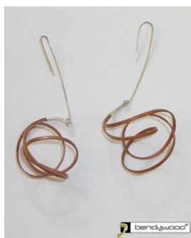
Gioielli in Bendywood®