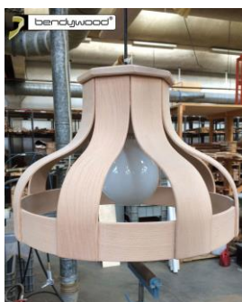
Candidus Prugger, Italia