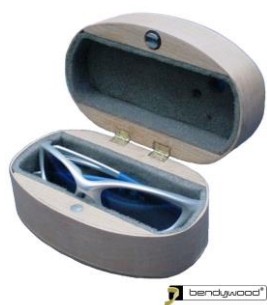
Portaocchiali in Bendywood®