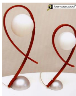
Lampada da tavolo in Bendywood®