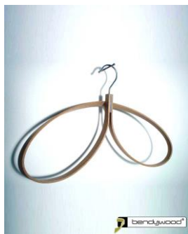
Appendino in Bendywood®