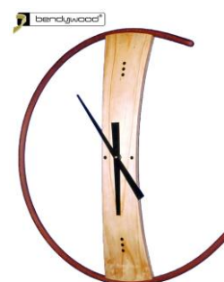
Orologio a parete "Moon Clock"