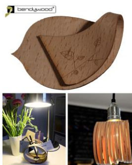
Regali promozionali in Bendywood®