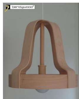
Candidus Prugger, Italia