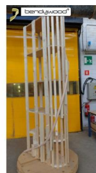
Dima per corrimano interno con curva a "u"