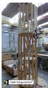
Dima per corrimano interno di una scala a chiocciola