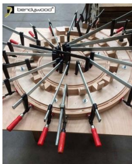
Dima per spirale per lampadario a luci LED