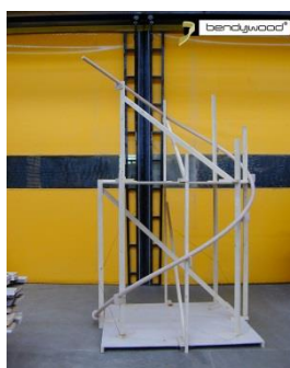
Dime per corrimano scale a chiocciola