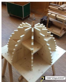
Dima per piegare una spirale piccola