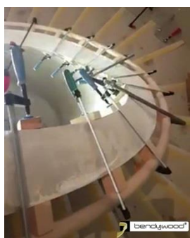
Dima per curvare sul muro