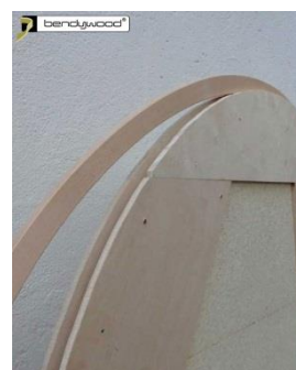
Dima per piegare corrimano e lista intagliata di costa