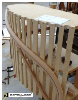
Dima per un corrimano piegato a 3D