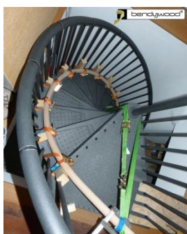
Dima sugli scalini di una scala a chiocciola