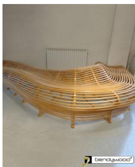
Candidus Prugger, Italia