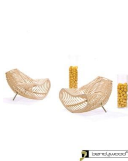
Pircher Oberland, Italia